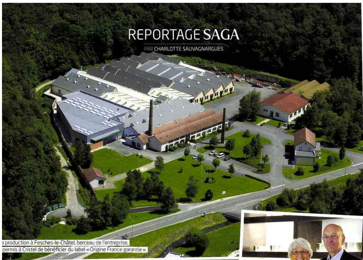
La production à Fesches-le-Châtel, berceau de l'entreprise, a permis à Cristel de bénéficier du label « Origine France garantie ».