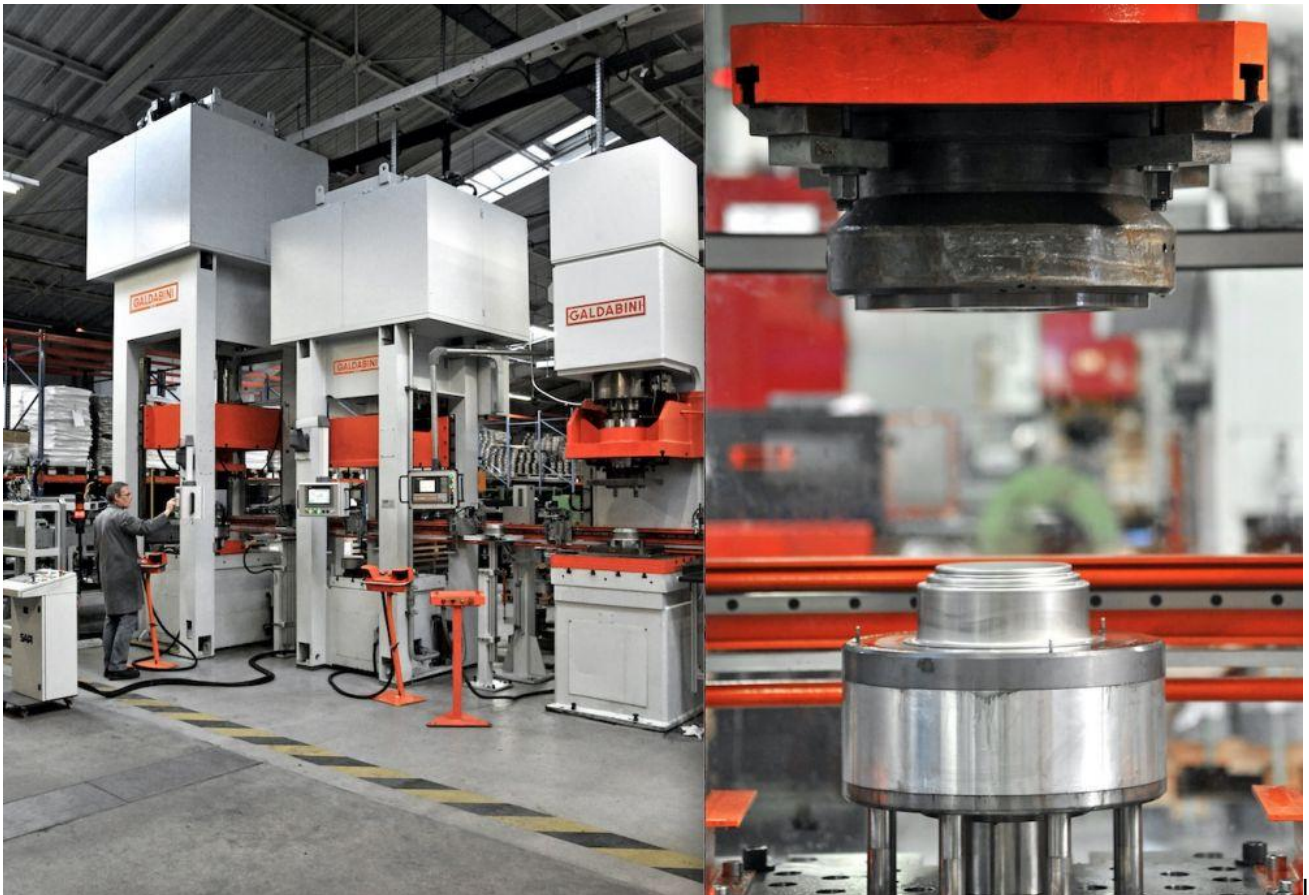
nouvelle ligne d'emboutissage.

« Cristel, c'est une prise de risque continue, nous ne nous sommes jamais contentés de tranquillité, d'acquis ou de réussite, même si nous avons bien conscience que tout cela est fragile. Mais nous avons toujours eu envie d'aller de l'avant dans le développement produit, et Paul Dodane a toujours le crayon à la main. » Un livre à paraître en 2018.